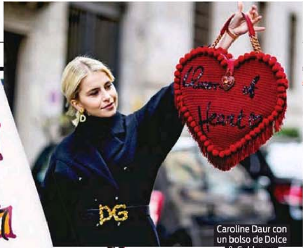
Caroline Daur con un bolso de Dolce & Gabbana.