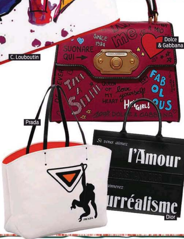
Dolce & Gabbana

Quizá ya tienes todo tipo de bolsos, pero seguro que te falta la novedad de muchas firmas: diseños con lemas, dibujos, frases o palabras que lo dicen todo. Y dirán también mucho de ti.